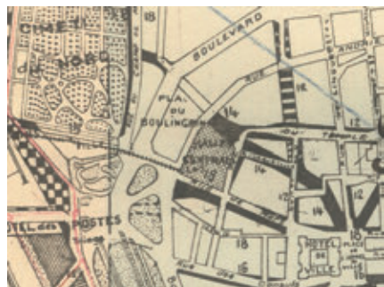
Plan de Reconstruction de Reims par George B. Ford, 1920

Comme le reste de la ville, la place des marchés est touchée par les obus de la Première Guerre mondiale mais sans destruction des bâtiments liés aux marchés. Fin 1919, la municipalité demande à George Burdett Ford, architecte américain ayant achevé ses études à l'école des Beaux-arts de Paris, d'étudier le plan de Reconstruction de Reims. Celui-ci envisage le transfert du marché en bordure de la place du Boulingrin, terrain libre proche de la gare. Cette place présente aussi l'avantage d'être desservie par de larges rues et d'offrir l'espace pour le stationnement. La construction du marché couvert est un projet essentiel pour relancer la vie sociale et économique de Reims.