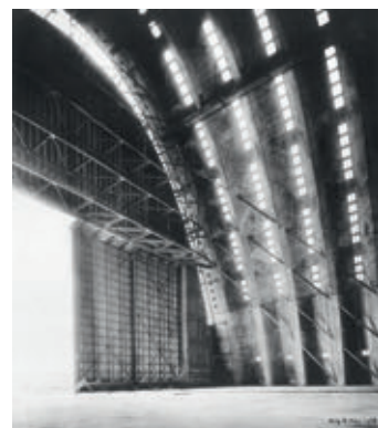
Hangars d'Orly, Société Limousin, procédés E. Freyssinet