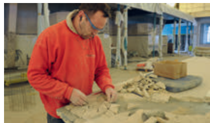
Pose de faïence sur les étals

En 2006, la municipalité décide de restaurer les halles et de leur redonner leur fonction originelle. Le chantier, financé par l'État, la Région et la ville de Reims, s'étend de 2010 à 2012. La maîtrise d'œuvre est confiée à François Chatillon, architecte en chef des monuments historiques, la maîtrise d'ouvrage à la Ville. Les chiffres du chantier sont vertigineux : 47 entreprises et 60 ouvriers au quotidien, 600 tonnes d'échafaudage, 900 m 2 de verres armés... L'enjeu principal est la restauration des superstructures avec la réparation des bétons tandis qu'une étanchéité liquide doit protéger la voûte des intempéries. Le monument étant classé, la restauration doit être la plus proche possible de la construction d'origine. Ainsi, les verres armés ont été coulés dans la même couleur jaune qu'à l'origine, les faïences proviennent du même fournisseur. Les traces de coffrage sur la voûte, typiques de la technique de construction des années 1920, ont aussi été restituées. Les halles ont fait l'objet d'une reconnaissance par le label Patrimoine du XX e siècle et, suite à leur restauration, par le prix Europa Nostra.