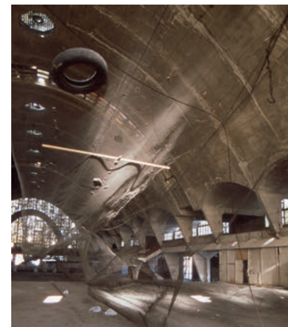
Filet de protection à l'intérieur des halles, années 90

Dès les premières années de fonctionnement, Émile Maigrot signale des fuites et une révision des carrelages à faire. En juin 1940, une bombe allemande détruit les verrières. Les nouveaux verres en double vitrage, créent un problème de condensation. Face à la chute de morceaux de béton, Eugène Freyssinet conclut en 1957 que les bétons vieillissent prématurément en raison de la condensation et d'un défaut de ventilation de la voûte. Un filet protecteur est installé sous la voûte tandis que l'ensemble du bâtiment se détériore petit à petit et ferme en 1988.