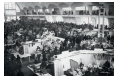
Le marché en 1930

De part et d'autre du carreau se trouvent des boutiques pour des commerçants permanents. L'étage consiste en une mezzanine qui accueillait des étals ainsi qu'une boucherie. Le premier marché a lieu fin octobre 1929, les halles sont un rendez-vous très apprécié des Rémois pendant de nombreuses années.