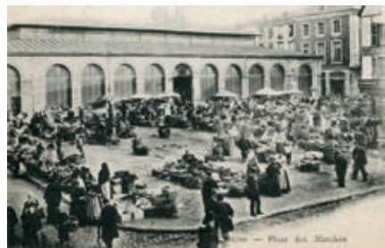
La place des marchés avant 1914

En 1838, on décide de démolir l'ensemble pour construire une halle couverte. Narcisse Brunette, architecte de la ville, la réalise en 1840. Composée d'une structure de fer masquée par des murs en pierres, il s'agit d'une des premières charpentes métalliques pour un bâtiment public. À quelques mètres, une autre charpente métallique abrite la criée tandis qu'un marché de plein air se tient plusieurs jours par semaine.