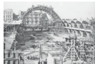
Vue du chantier de construction, septembre 1927

Le chantier débute en février 1927 et s'achève deux ans plus tard. Le bâtiment est impressionnant par ses dimensions, 109 m de long et 19 m de hauteur. Mais c'est surtout la voûte parabolique qui attire l'attention : en béton, elle ne fait que 7 cm d'épaisseur. La particularité est l'absence de doubleaux, reportés à l'extrados (face extérieur) de la voûte. Comme pour les hangars d'Orly, Freyssinet emploie un verre armé de 5 à 7 mm d'épaisseur, de couleur jaune, sans incidence pour les produits alimentaires. Le soubassement extérieur du bâtiment et l'entourage des quatre portes latérales sont réalisés en Lap (ciment poli), matériau nouveau, ici de couleur verte, et plus résistant que le marbre.