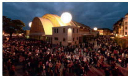
L'inauguration des halles en septembre 2012

Inaugurées en septembre 2012, les halles ont aujourd'hui plusieurs vocations. Elles abritent le marché du centre-ville 3 jours par semaine. La mezzanine accueille des expositions temporaires et le carreau est ponctuellement le lieu de manifestations.